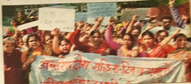
जनताई महिला समिति ने बुलंद नगर जिले में महिलाओं के अधिकारों के लिए आवाज उठाई।

अंतरराष्ट्रीय महिला दिवस के अंतर्गत मनाया गया। उन्होंने कहा कि देश में महिलाओं को सशक्त बनाने के लिए हमें उनके अधिकारों के प्रति जागरूक बनना होगा।