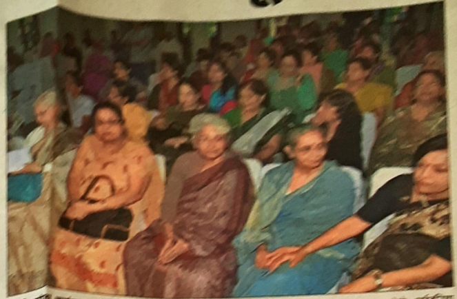
महिलाओं को सशक्त बनाने के लिए अंतरराष्ट्रीय महिला दिवस समारोह में भाग लेने वाली महिलाएं।

महिलाएं अपने अंतराष्ट्रीय आत्मनिर्भरता के लिए देश की उन्नति में सशक्त भूमिका निभाएं।