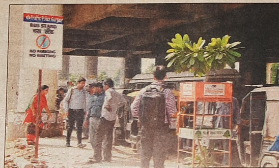
SIGN OF THE TIMES: Commuters demand better services